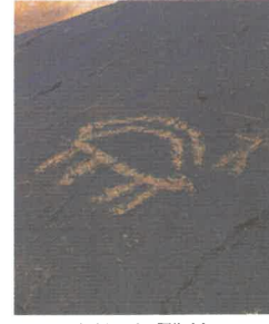
Hakkari - Türkiye