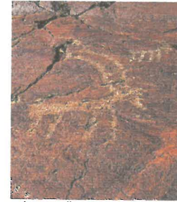
İzmir - Ödemiş - Turchia