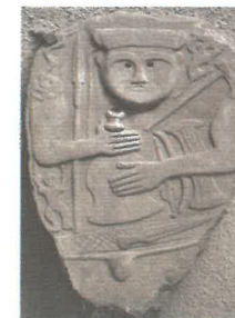
Van - Turchia